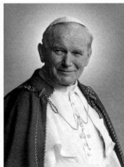
Błogosławiony Jan Paweł II papież LITANIA

Błogosławiony Janie Pawle II, przez znak Twojego świętego życia wychwalamy Boga Miłosiernego. Chcemy trwać w duchu ośmiu błogosławieństw, zauważać ludzi potrzebujących życzliwego spojżenia, z pokorą przyjmować krzyż jako dar przemieniający nasze codzienne słabości. Doznaliśmy – choć nie jesteśmy tego godni – wielu łask płynących z Nieba. Niech one przez Twoje wstawiennictwo umacniają nasze istnienie, kierując je w stronę tajemnicy zmartwychwstania, w świetle której rozwiązują się wszelkie trudności i każdy człowieczy ból. Prosimy, abyś orędowną za nami i za całym światem w blasku Bezinteresownej Czystej Miłości. Amen.