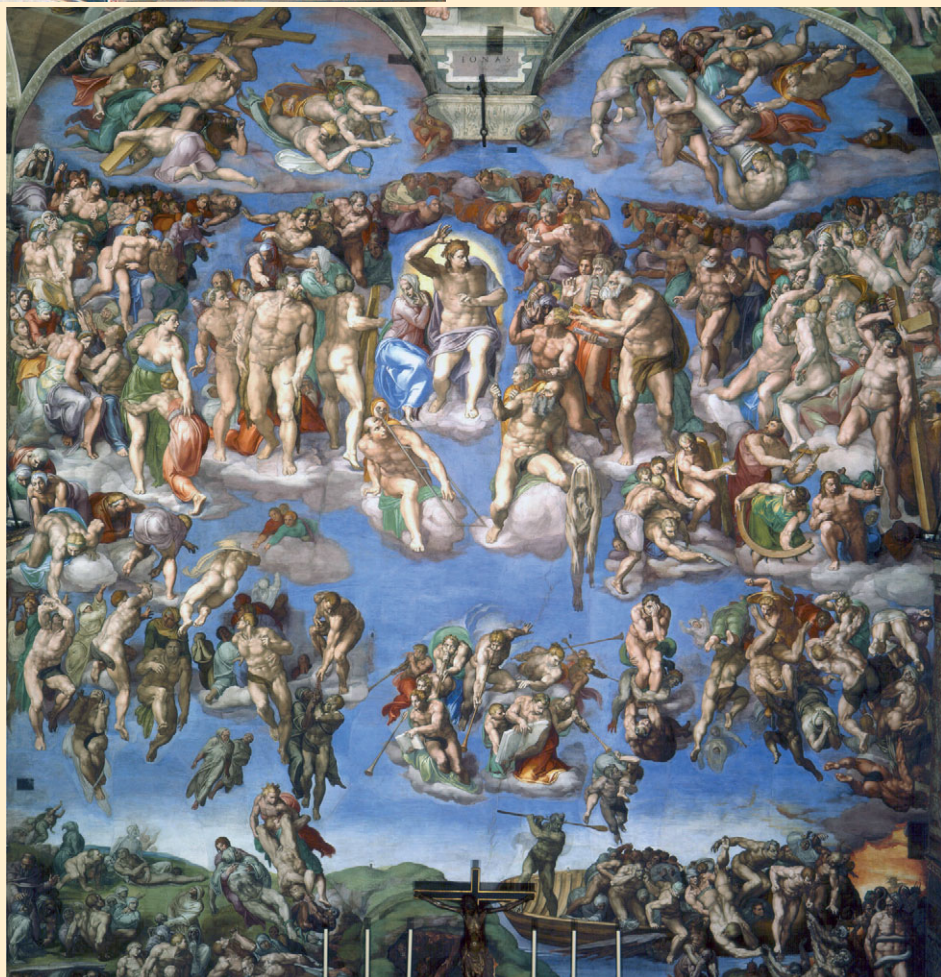
SĄD OSTATECZNY, MICHAŁ ANIOŁ /1471 – 1564/. Fresk, Kaplica Sykstyńska, Watykan