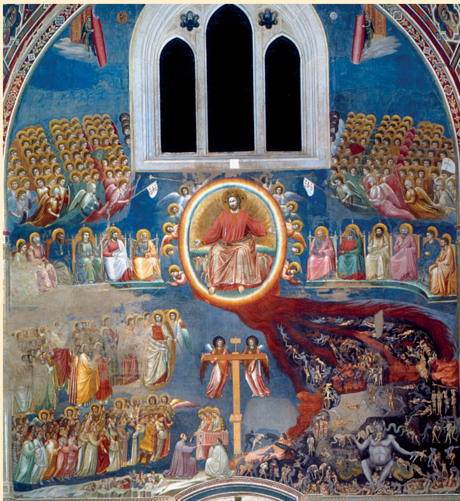
SĄD OSTATECZNY, GIOTTO /ok. 1267 – 1337/. Fresk, Capella degli Scrovegni, Padwa.