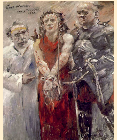
ECCE HOMO, Louis Corinth (1925), Muzeum w Bale.