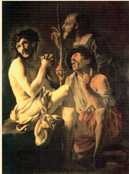
WYSZYDZENIE CHRYSTUSA, Terbrugghen (1588 - 1623).