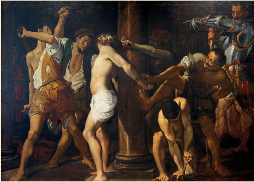
BICZOWANIE, z połowy XVI wieku, Ludovico Carraci (1555 - 1619)