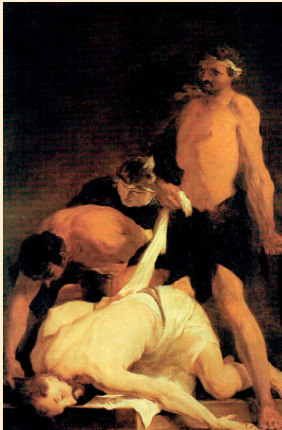
CHRYSTUS OMDLAŁY PO BICZOWANIU, Lioński artysta PIERRE - LUIS CRETEY, Muzeum w Marsylii.