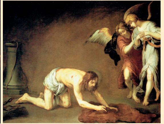
CHRYSTUS ZBIERAJĄCY SWOJE SZATY PO UBICZOWANIU, Bartolome Esteban Murillo (1617 - 16982) Muzeum w Bostonie.