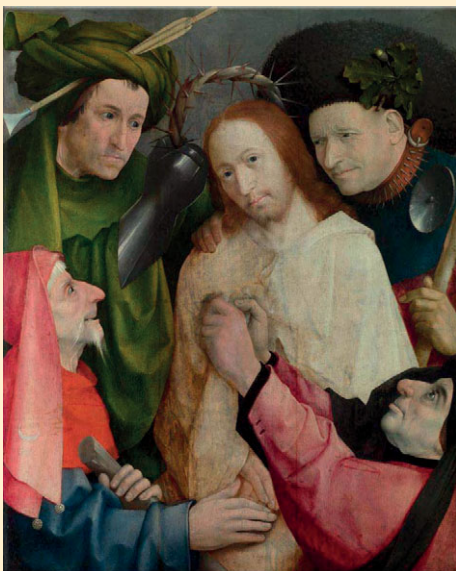
KORONOWANIE CIERNIEM, Hieronim Bosch (1450 - 1516) Muzeum Narodowe w Londynie.