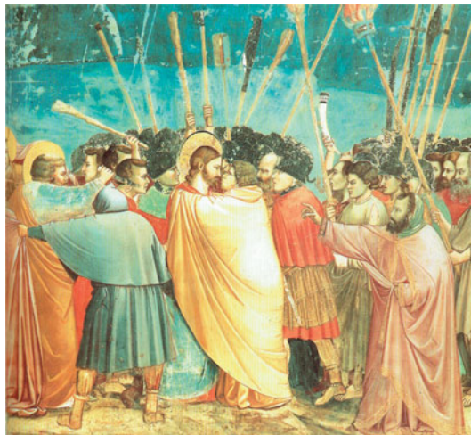
POCALUNEK JUDASZA. SCENY Z ŻYCIA CHRYSTUSA, 1304/06, GIOTTO, fresk w kaplicy Scrovegnich, Padwa.