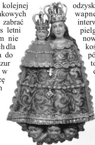
Przyczyna Naszej Radości - Maria Śnieżna Góra Igliczna

Sanktuarium „Maria Śnieżna” znajduje się w paśmie Sudetów Wschodnich, w Masywie Śnieżnika, najwyższej góry tego pasma. Samo sanktuarium zbudowane jest na wzniesieniu o nazwie Góra Igliczna, mającym wysokość 750-780 m n.p.m. Charakterystycznie ścięty szczyt z bielejącą bryłą jasnego, barokowego kościoła widoczny jest już z daleka, a szczególnie malowniczo wygląda, gdy poruszamy się drogą od strony Bystrzycy Kłodzkiej. U podnóża góry rozpościera się miejscowość Wilkanów, lecz na szczyt dociera się od strony niezwykle urokliwej wsi Międzygórze, zwanej najpiękniejszą wsią Dolnego Śląska. W 1750 roku wójt wspomnianego Wilkanowa miał przywieźć tu na pamiątkę pielgrzymki figurę Marii z Dzieciątkiem, będącą kopią Madonny z Marizell w Austrii. Ludową rzeźbę ustawiono pod konarami rozłożystego buka. Kiedy piętnaście lat później okolicę nawiedziła potężna wichura, powalając owo drzewo, figura nie ucierpiała. Uznano to za znak od Opatrzności i zbudowano drewnianą kaplicę, która już po kilka latach stała się za mała z uwagi na rozwijający się ruch pielgrzymkowy. Na rozwój ten dobitnie wpłynęły cudowne uzdrowienia, jakie miały się dziać za przyczyną Matki Bożej z Góry Iglicznej. Do tej pory dokładnie udokumentowano kilkanaście takich wydarzeń. Pierwsze miało miejsce 26 czerwca 1777 roku – wówczas to syn Wawrzyńca Frankego z nieodległej Siennej